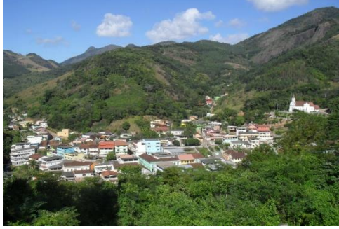
Cidade de Santa Leopoldina/ES