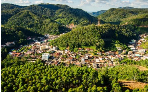
Cidade de Santa Teresa/ES

A FCCA pretende realizar a Etapa "1Adventure South America World Cup" - "1Adventure Brasil Adventure Racing National Series" na região das montanhas do Espírito Santo (ES), com sede no município de Santa Teresa/ES e o percurso passa pelos municípios de Santa Leopoldina/ES e Santa Maria de Jetibá/ES, região conhecida como "dos Imigrantes". Santa Teresa/ES foi a primeira cidade de colonização italiana no Brasil. Santa Leopoldina/ES teve inicialmente imigrantes suíços, alemães, e austríacos. Santa Maria de Jetibá/ES teve colonização pomerana e alemã.