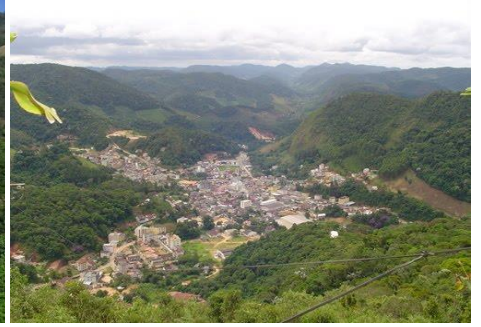
Cidade de Santa Maria de Jetibá/ES

A cidade turística de Santa Teresa/ES fica a apenas 78 km do aeroporto VIX (Vitória/ES), cerca de 01:20 h de ônibus, pelas rodovias BR-101 e ES-261, e com sede (largada) a 675 metros acima do nível do mar e com altitude máxima de 1083 m. Santa Leopoldina com sede a 17 m ao nível do mar, por ficar num vale formado pela calha hidrográfica do rio "Santa Maria" e altitude máxima de 915 m. Santa Maria de Jetibá tem sede a 720 m acima do nível do mar e altitude máxima de 1450 m na "Pedra do Garrafão", e a cidade também possui um Horto Florestal (reserva de preservação) e diversas cachoeiras em seu município.