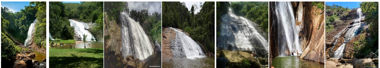
"Véu de Noiva" "Rio do Meio" "do Palito" "de Holanda" "do Galo" "Moxafongo" "Country Club"

A etapa terá as modalidades de "Mountain Bike", "Trail Run" e "Canoeing" e duas provas especiais de vertical com "Rapel" em cachoeiras, e navegação por carta topográfica em lona colorida em alta resolução de impressão, num percurso cerca de 200 km a 210 km, com duração prevista de 24h a 30h de duração, passando por regiões montanhosas e pelo circuito "das cachoeiras", com previsão de passar por 6 a 7 cachoeiras distintas.