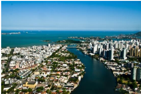
Cidade de Vitória/ES (aeroporto VIX)

A cidade turística de Santa Teresa/ES fica a apenas 78 km do aeroporto VIX (Vitória/ES), cerca de 01:20 h de ônibus, pelas rodovias BR-101 e ES-261, e com sede (largada) a 675 metros acima do nível do mar e com altitude máxima de 1083 m. Santa Leopoldina com sede a 17 m ao nível do mar, por ficar num vale formado pela calha hidrográfica do rio "Santa Maria" e altitude máxima de 915 m. Santa Maria de Jetibá tem sede a 720 m acima do nível do mar e altitude máxima de 1450 m na "Pedra do Garrafão", e a cidade também possui um Horto Florestal (reserva de preservação) e diversas cachoeiras em seu município.